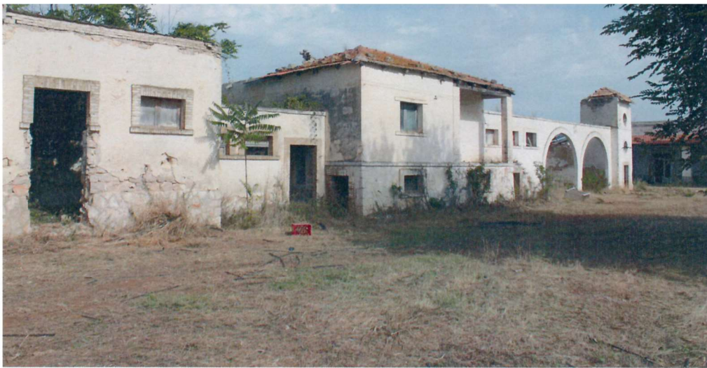
Corpi di fabbrica lato ovest

Per la più ampia diffusione, l'avviso sarà esteso non solo agli enti territoriali (Regione Puglia, Provincia di Foggia ed i sei Comuni nei quali ricadono i terreni dell'ASP – San Nicandro Garganico, Apricena, Foggia, Lesina, Poggio Imperiale e San Severo), ma anche alla CCIAA di Foggia, alle federazioni ed organizzazioni regionali e nazionali del Terzo Settore e del Settore Agricolo; inoltre, si ha in animo di pubblicarne un estratto su giornali specializzati, su siti tematici del web e, al fine di allargare al massimo la conoscibilità dell'avviso e la platea dei possibili interessati a proporsi come promotori, di attuare specifiche comunicazioni o inserzioni in particolari occasioni (fiere e convegni specializzati inerenti il welfare, l'agricoltura ed il turismo, eventi specifici, etc.).