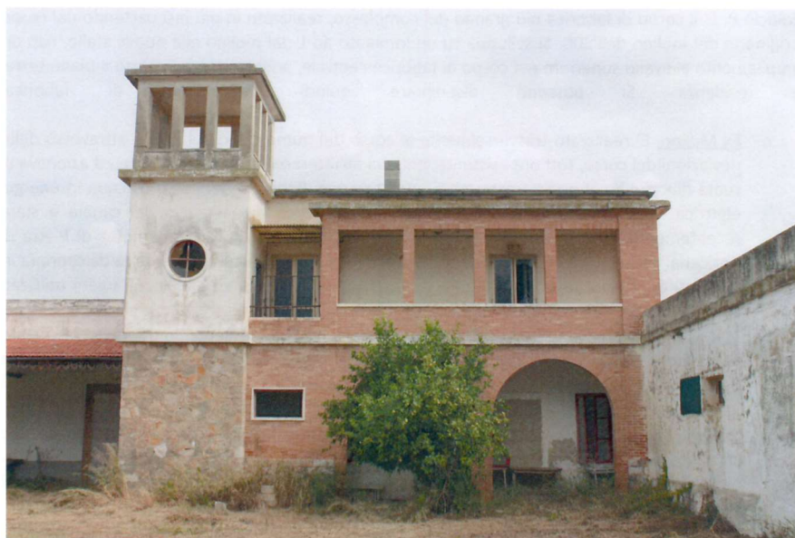
Facciata principale dell'immobile

Da mercoledì 6 maggio 2020 sono riaperti i termini dell'avviso esplorativo per acquisire manifestazioni di interesse alla gestione del “ Mulino del Caldoli ”, mediante lo strumento della finanza di progetto, per la conversione della struttura a scopi sociali.