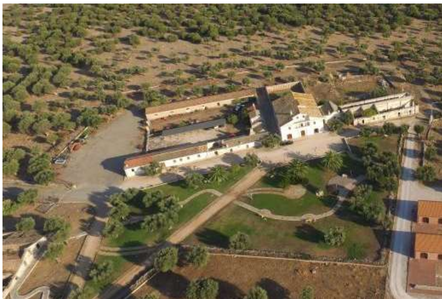
Veduta dall'alto della sede istituzionale ASP

Venerdì 8 maggio 2020 ha avuto inizio la pubblicazione dell'avviso esplorativo per acquisire manifestazioni di interesse alla progettazione, finanziamento, realizzazione, gestione e manutenzione di tettoie o gazebo o pensiline o pergole dotate sulle coperture di pannelli per la produzione di energia elettrica da fonte solare (fotovoltaico), mediante lo strumento della finanza di progetto, nell'ampia superficie circostante la sede istituzionale in località San Nazario, agro di San Nicandro Garganico (Fg).